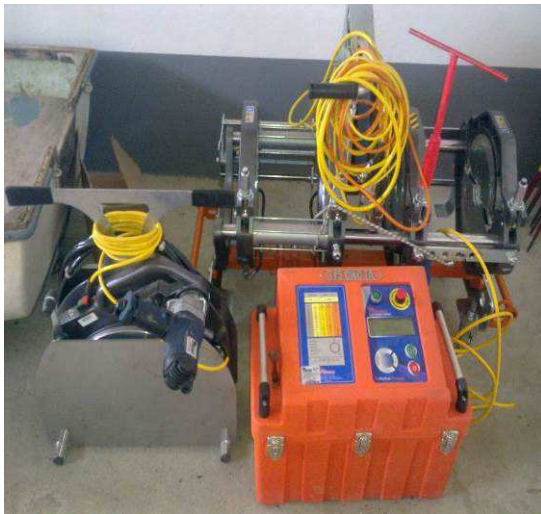
Máquina de soldar T/T Automática DN 90/315(EPC)