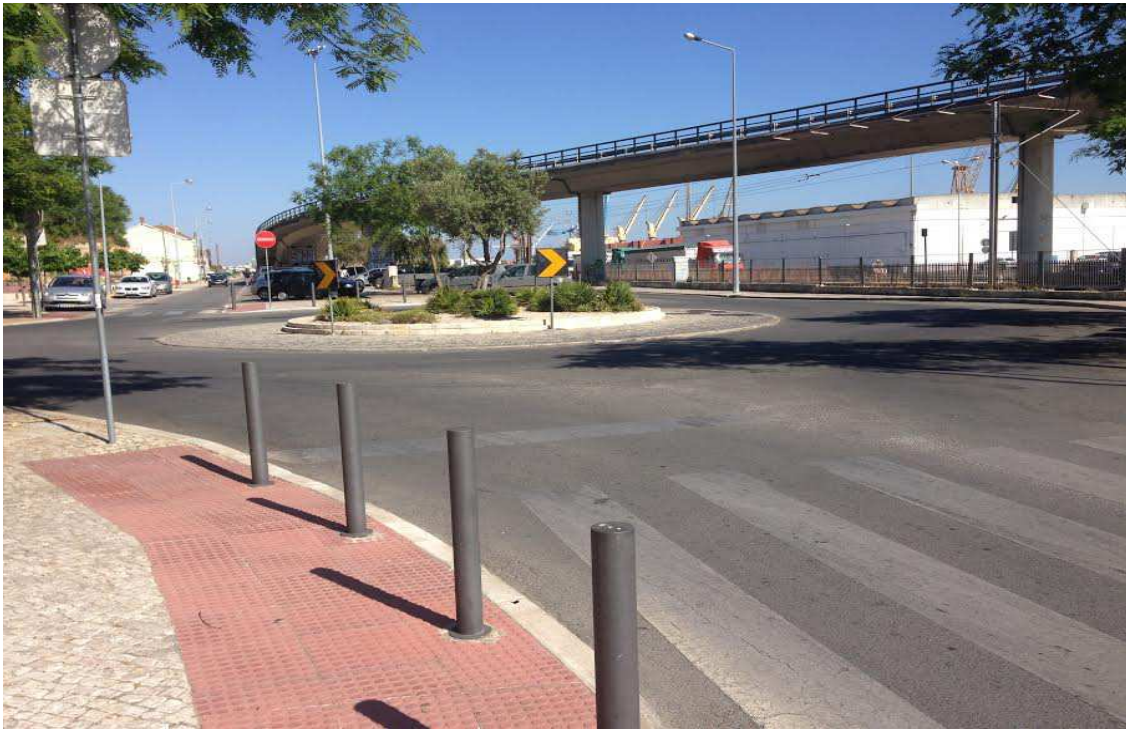
C.M. Setúbal – Requalificação da Rua das Fontainhas