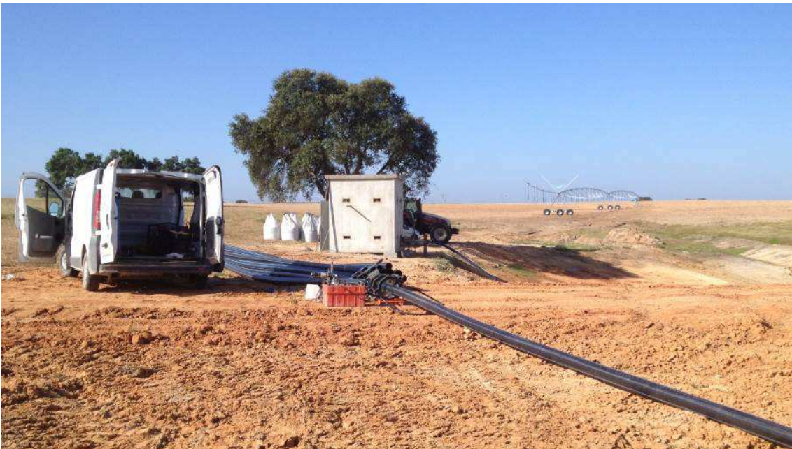
Herdade Vale da Hera – Rede de Rega PEAD DN 125 PN6 MRS100 SDR11