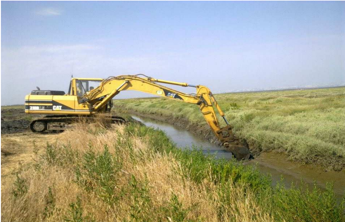
A.P.L. - Limpeza de Esteiros – Herdade de Pancas