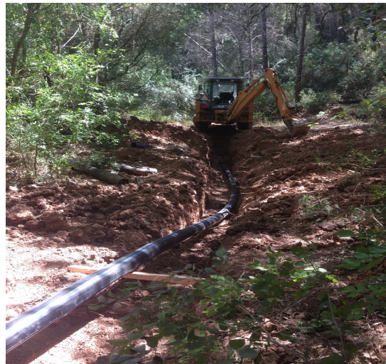
C.M. Setúbal: Empreitada: “REABILITAÇÃO DA REDE DE ABASTECIMENTO DE ÁGUA DO SISTEMA CARRASCAL/CREIRO - 2ª FASE” – Instalação de PEAD DN 140 PN16 MRS100 SDR11 – 828,00 ml em Vala e 785,00 ml através do processo de “Sliplining”.