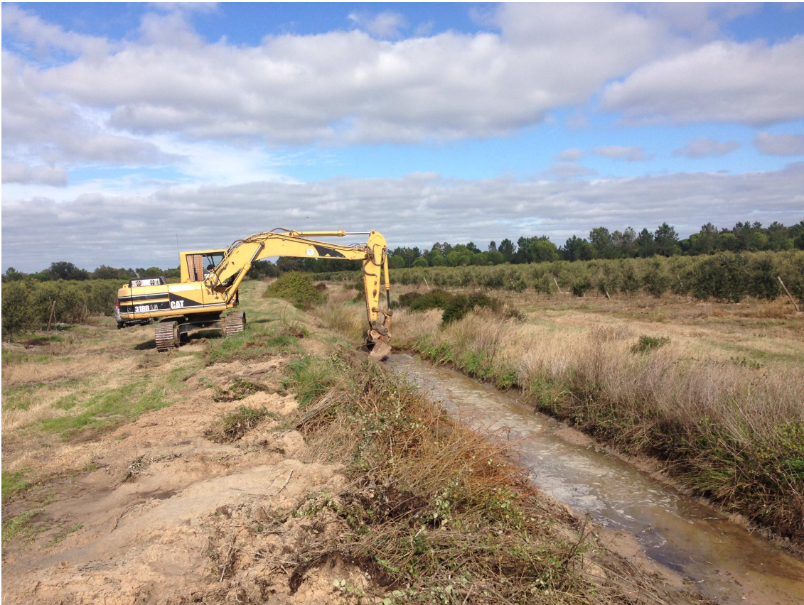
Grupo Sovena – Elaia2, Investimentos S.A. – Execução e Limpeza de Linhas de Água