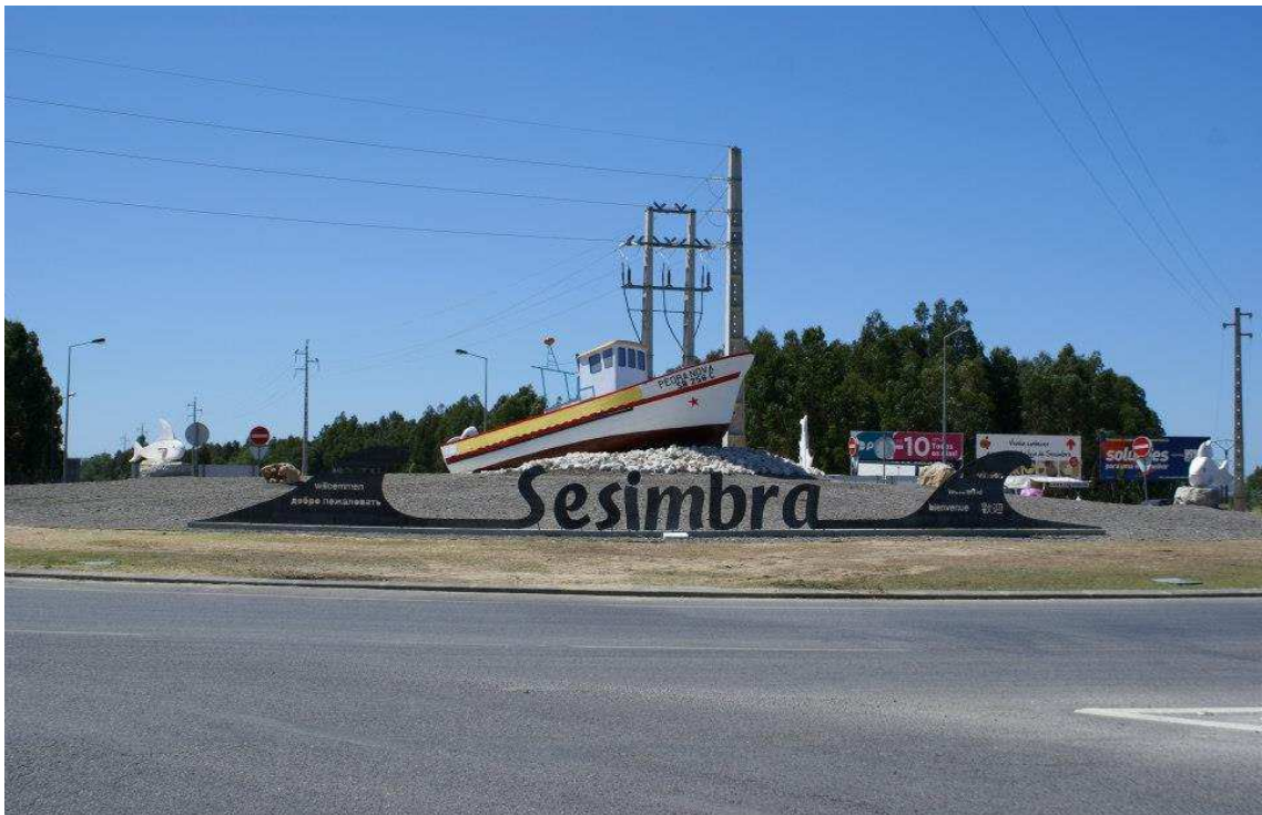
C.M. Sesimbra – Rotunda do Marco do Grilo – Monumento ao Pescador