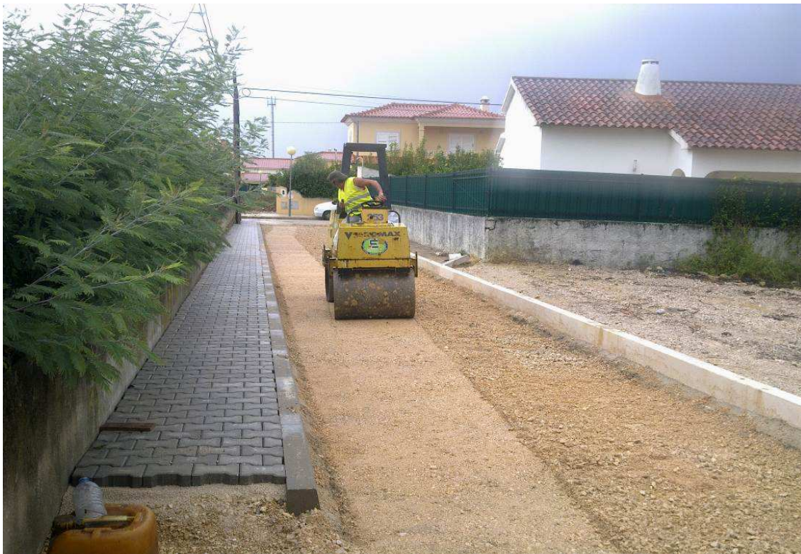
C.M. Setúbal – Execução de Pavimentos em Tout- Venant/ Pavê