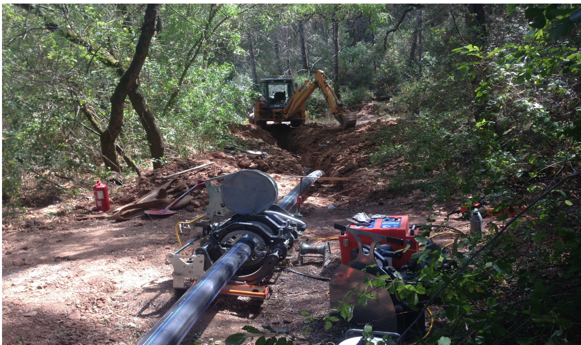
C.M. Setúbal: Empreitada: “REABILITAÇÃO DA REDE DE ABASTECIMENTO DE ÁGUA DO SISTEMA CARRASCAL/CREIRO - 2ª FASE” – Instalação de PEAD DN 140 PN16 MRS100 SDR11 – 828,00 ml em Vala e 785,00 ml através do processo de “Sliplining”.