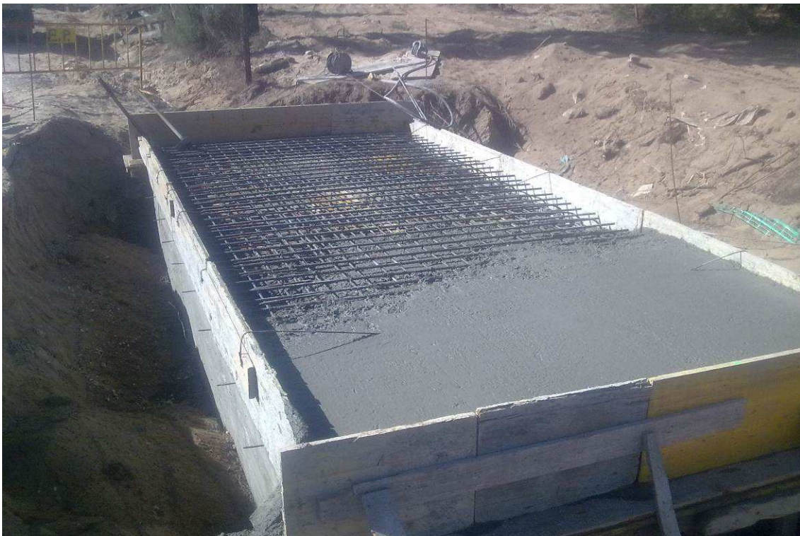
C.M. Setúbal – Passagem Hidráulica