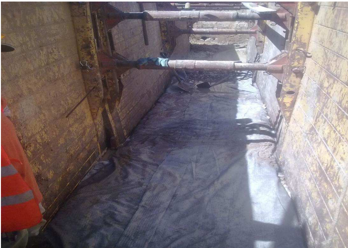
C.M. Setúbal – Rebaixamento de Nível Freático