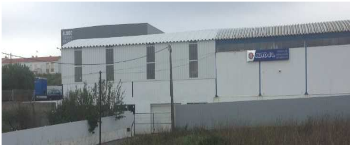
Oficina AUTO JL – Zambujal – Ampliação de Oficina