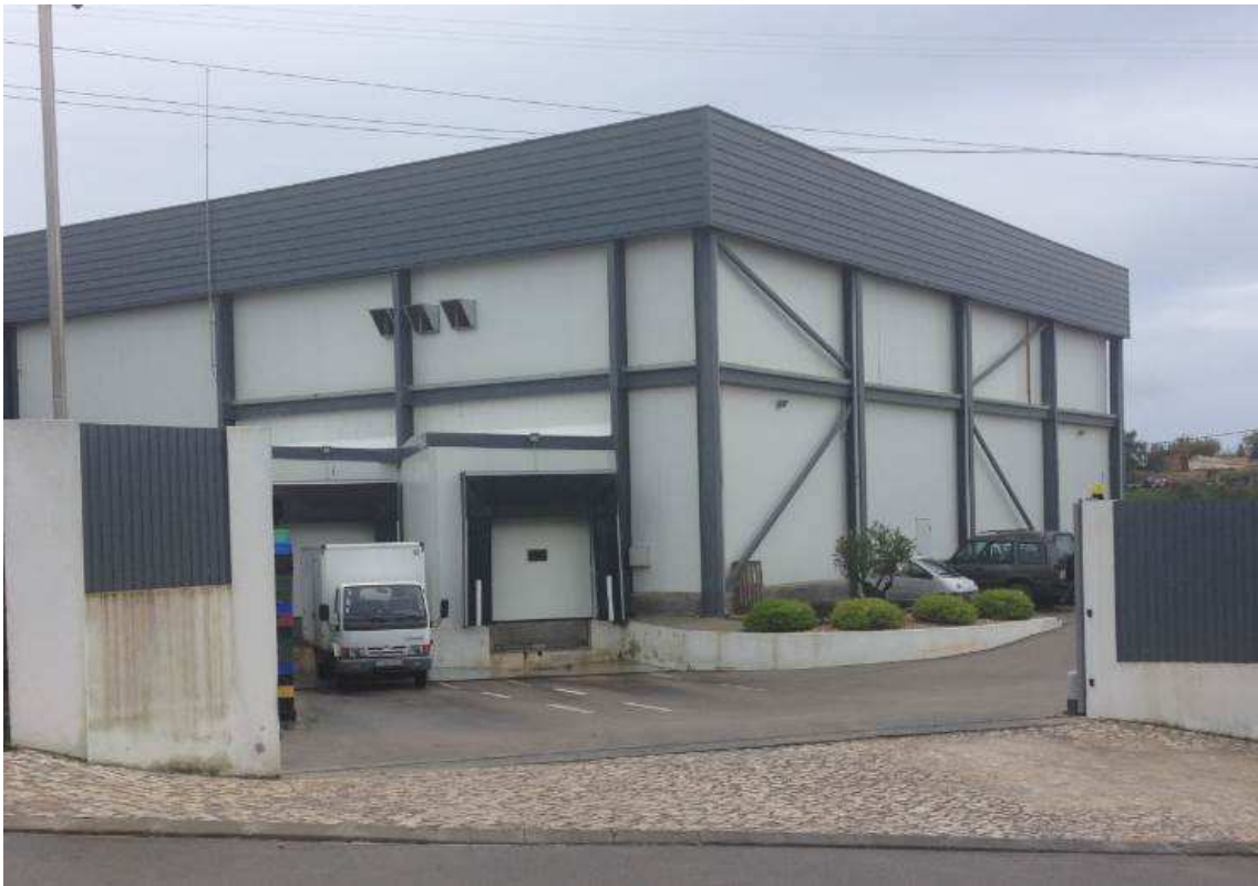
Docapesca – Zambujal – Fabrica de transformação de pescado