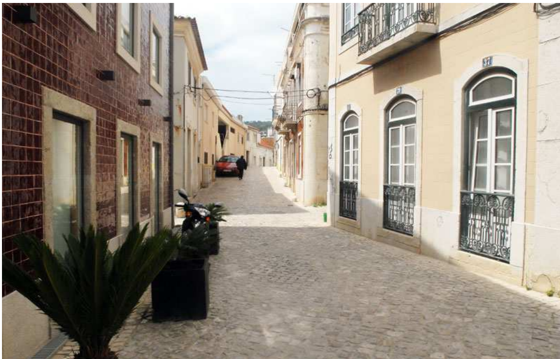
C.M. Sesimbra - Recuperação Urbana do Núcleo Antigo de Sesimbra (RUNAS) - Nascente e Poente