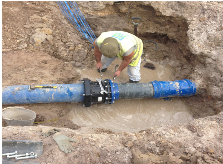
Canana & Filhos, Lda – Ligação FFD DN 250/ PVC DN 250