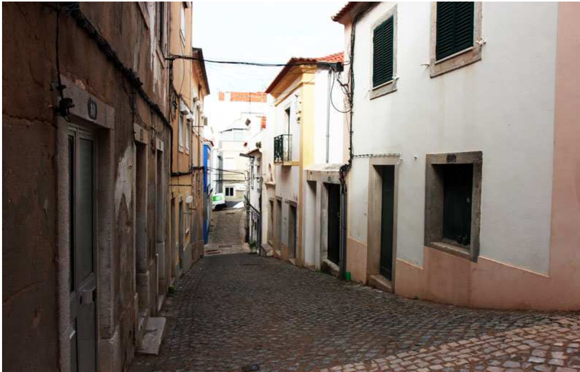
C.M. Sesimbra - Recuperação Urbana do Núcleo Antigo de Sesimbra (RUNAS) - Nascente e Poente