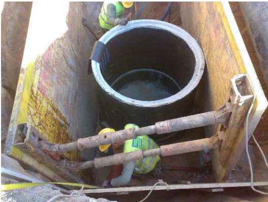
Águas do Sado, S.A.

A Indústria da Água e Ambiente é uma das principais áreas de acção da nossa actividade, a Eduardo Pires Construções, Lda possui uma enorme capacidade técnica reconhecida e uma grande experiência na execução de diversas infraestruturas onde já interveio em diversas tipologias dentro desta área. Esta empresa tem a ambição de ser uma referência na execução de redes de Águas, tratamento de esgotos, águas residuais e movimentação de terras.