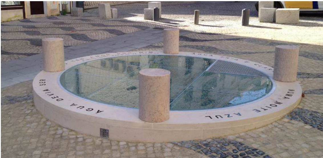
C.M. Almada – Recuperação do Poço de Cacilhas