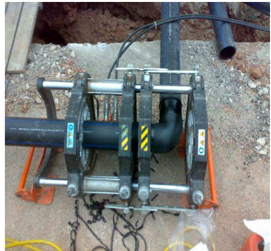
Máquina de soldar T/T Manual – DN 75/250(EPC)