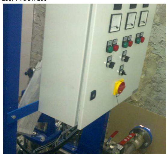
C.M. Palmela – Fornecimento e Montagem de Equipamento Eletromecânico