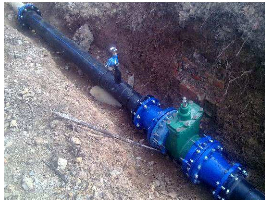
C.M. Sesimbra – Remodelação de Conduta